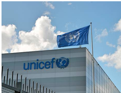
ইউনিসেফ-প্রধান সদর দপ্তর

UNICEF-এর ভাষায় স্বাস্থ্যবিধি হচ্ছে, অসুস্থতা বা রোগের বিস্তার প্রতিরোধ কল্পে ব্যক্তি ও তার চারপাশের পরিবেশ পরিচ্ছন্ন রাখার নির্দেশনাবলি। স্বাস্থ্যবিধিতে মানুষের ব্যক্তি পর্যায় থেকে তার বিচরণের সমগ্র ক্ষেত্র অন্তর্ভুক্ত। অর্থাৎ জনজীবন থেকে জনস্বাস্থ্য পর্যন্ত এর আওতাভুক্ত। স্বাস্থ্যবিধির মাধ্যমে মানুষ আজ সুস্থ, সফল ও সার্থক জীবন গড়ে তুলতে প্রয়াসী যা প্রকৃত শিক্ষা ও উন্নয়নকে সুস্পষ্ট করে।